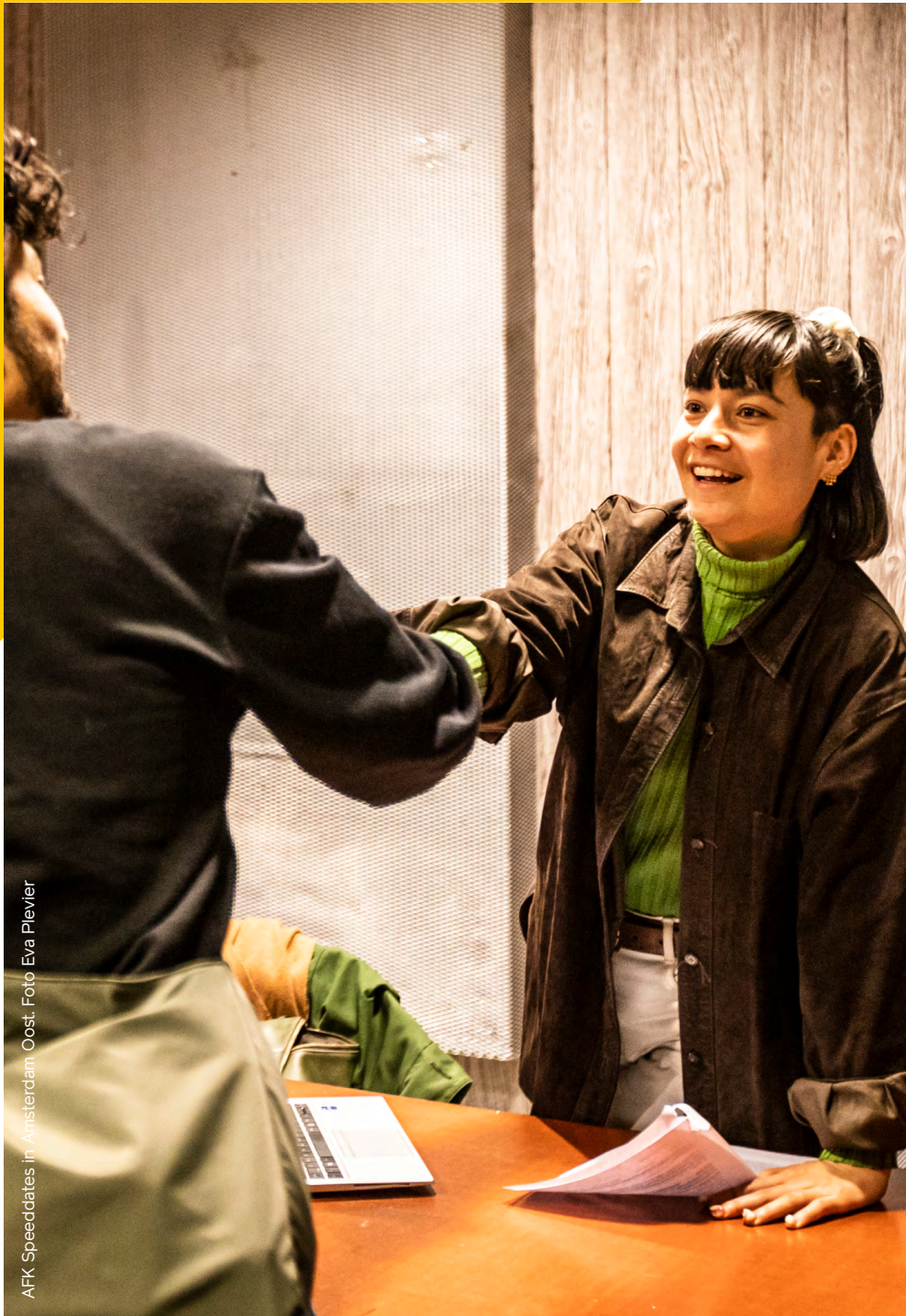
AFK Speeddates in Amsterdam Oost.