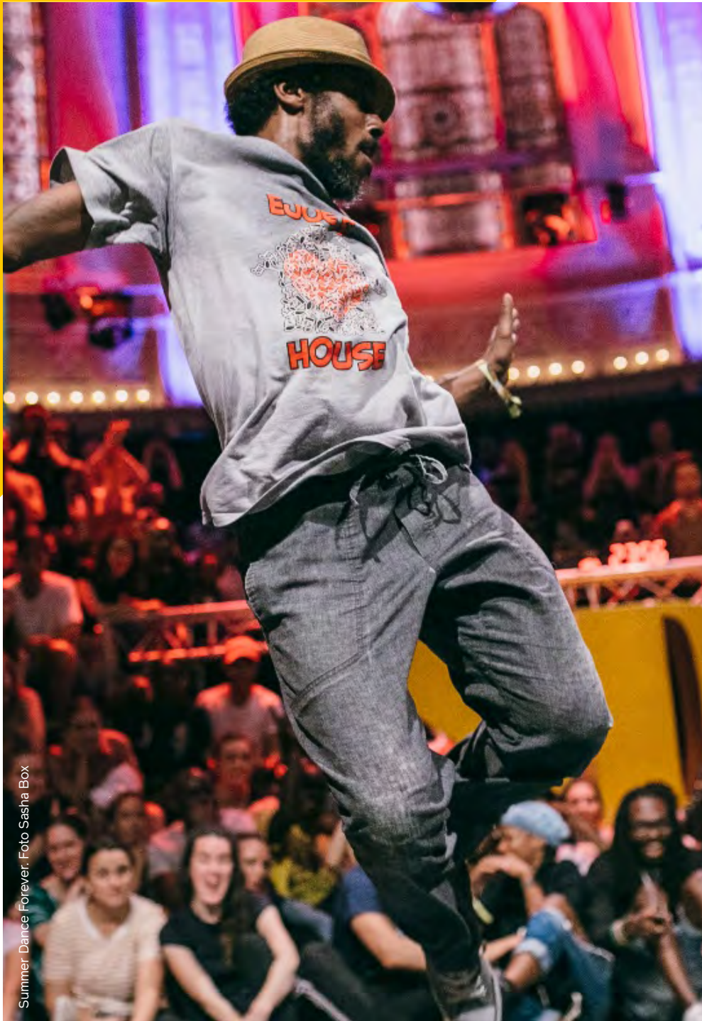
Summer Dance Forever.