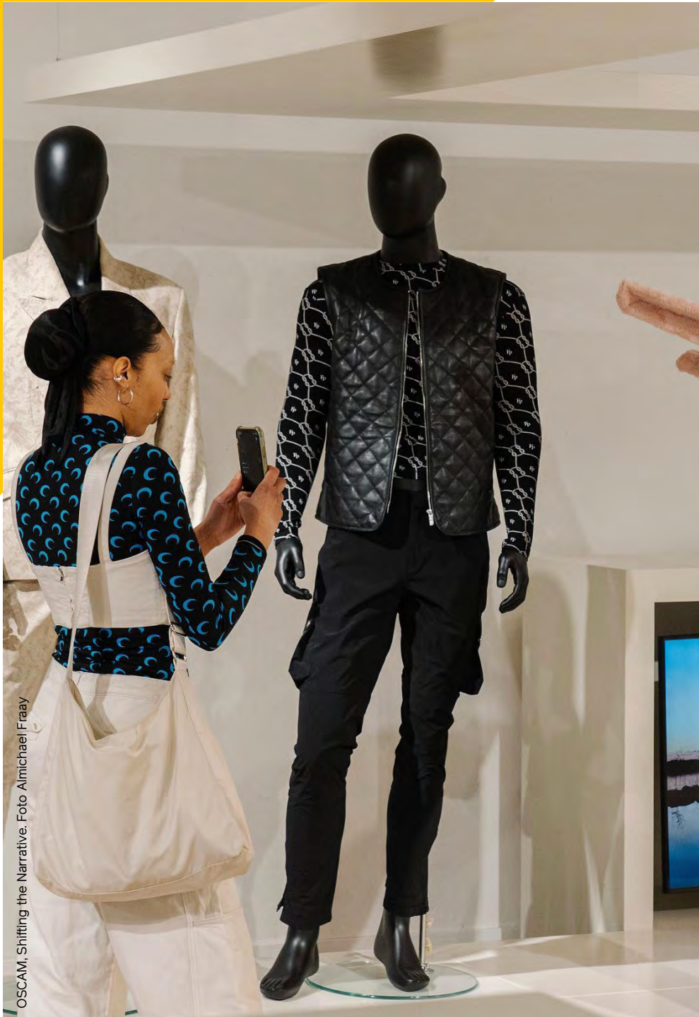
OSCAM. Shifting the Narrative.