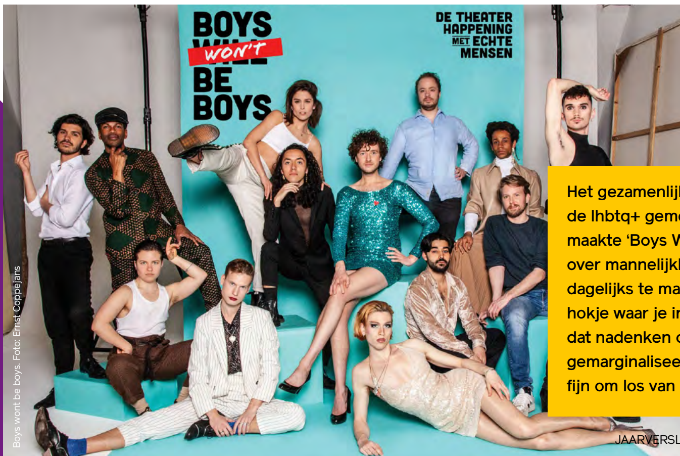
Boys wont be boys.

In de regeling Ontwikkeling kan onder andere worden aangevraagd voor artistieke ontwikkeling, waaronder nieuwe vormen en disciplines of thema's. Van de zestien organisaties die in 2022 gebruikmaken van de regeling Ontwikkeling van het AFK (2021-2022 én 2022-2023), zetten er zes in op artistieke ontwikkeling.